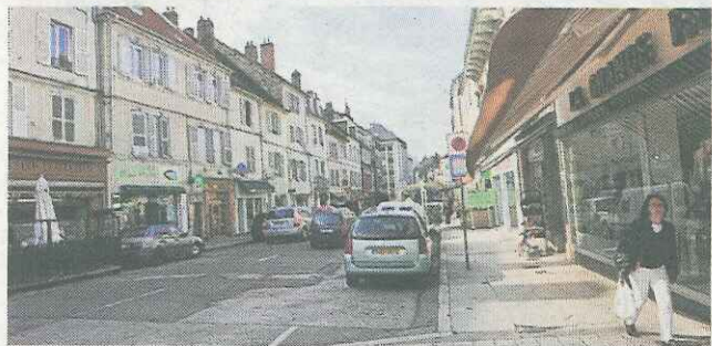
■ Enrobé, trottoirs vont être refaits à neuf.

« Cela va donner un coup de neuf à la rue. Et on est tous d'accord là dessus : une voie de circulation c'est mieux. »