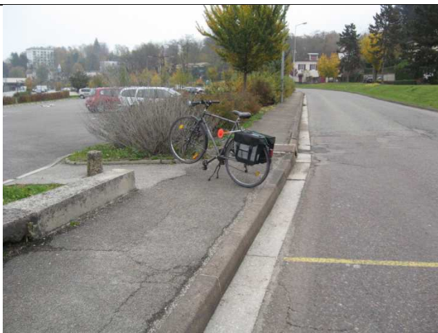
De Macornay à Lons – Photo 3