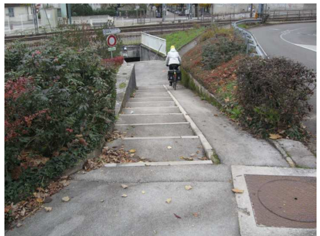
De Macornay à Lons – Photo 6