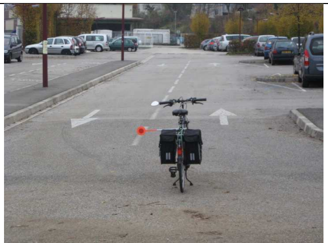
De Macornay à Lons – Photo 4