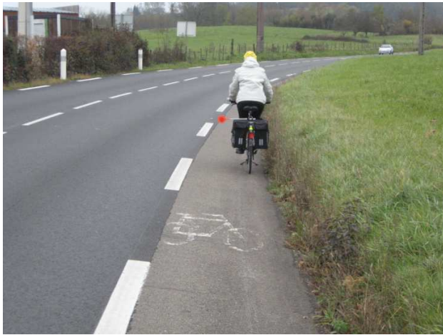
De Macornay à Lons – Photo 1