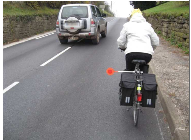
De Macornay à Lons - Photo 2