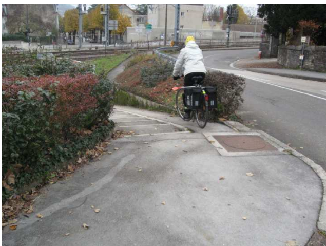
De Macornay à Lons – Photo 5